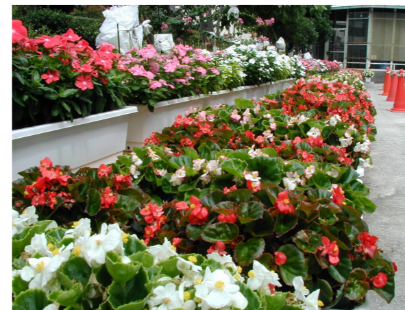
出番はまだかな・・・

平成13年10月6日(土)～9日(火)、県内の各会場で、2001ねんりんピック広島が開催されます。西区内では、10月7日(日)、広島サンプラザにて社交ダンスの競技(高齢者の部、一般参加の部)が行われます。西区市民運動推進協議会では、競技者をお迎えするにあたり、さまざまな運動を展開しています。