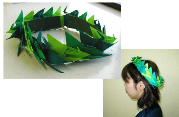
はっぱのひとつひとつがオリヅルなんです。